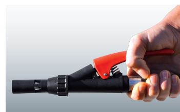
Dreh- und abstellbare Löschpistole